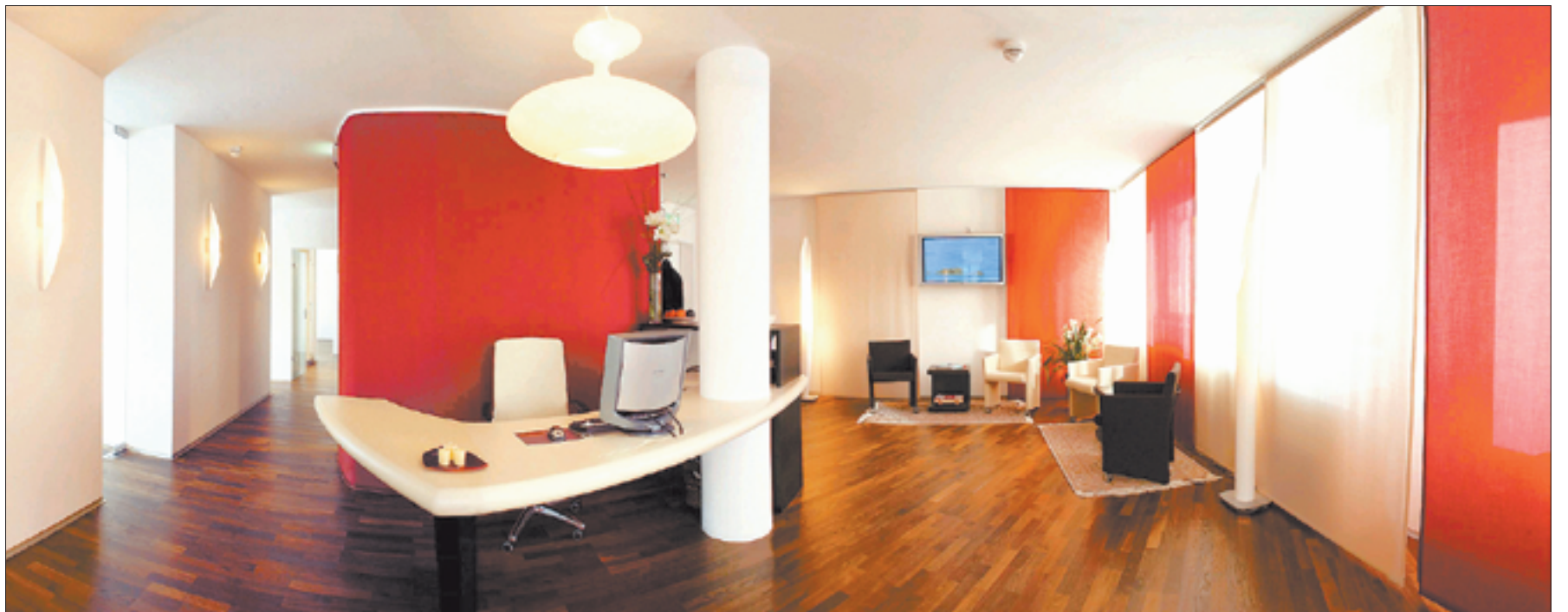
Der Empfangsbereich der Praxis für Zahnheilkunde erinnert an ein elegantes Wohnzimmer.