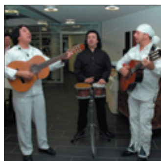
Sorgten für Stimmung: Barretta.