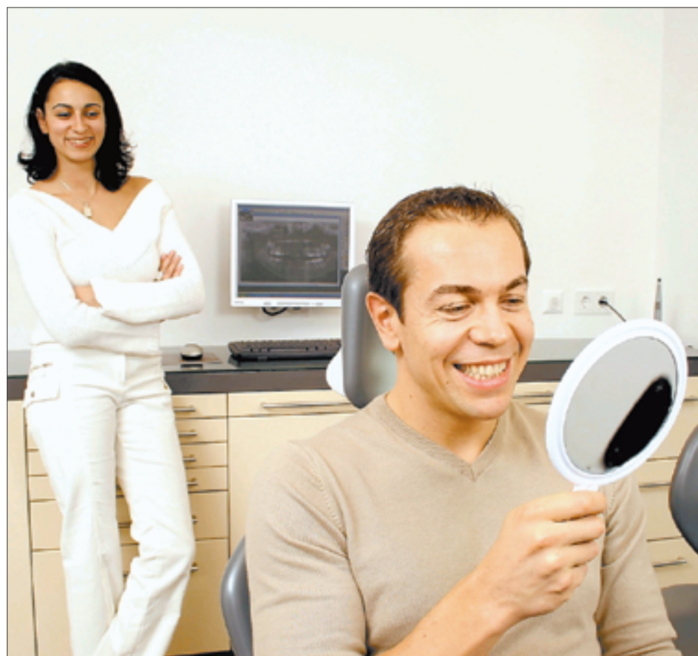
Gesunde und schöne Zähne nach der Behandlung.

Implantate können langfristig die Kaufunktion von ca. zwei natürlichen Zähnen übernehmen; nicht jeder eigene Zahn muss also durch ein Implantat ersetzt werden. Die strategisch richtige Positionierung im Kiefer ist dafür aber entscheidend, was entsprechende Erfahrung voraussetzt.