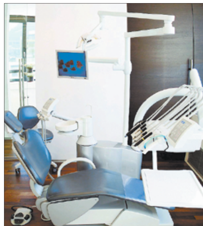
Hochmoderne Technik als Kennzeichen der Praxis.

Die persönliche Betreuung beginnt bereits am Empfang und setzt sich während des gesamten Aufenthalts in der Praxis im Medicent fort. Mit jedem Patienten wird vor der Behandlung ein umfassendes Beratungsgespräch geführt. Ziel ist es, die Vorstellungen des Patienten von Anfang an miteinzubeziehen.